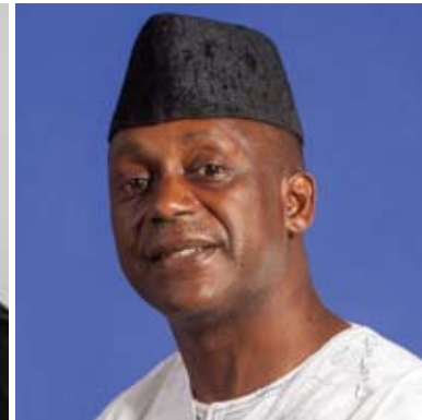
Kandeh K. Yumkella