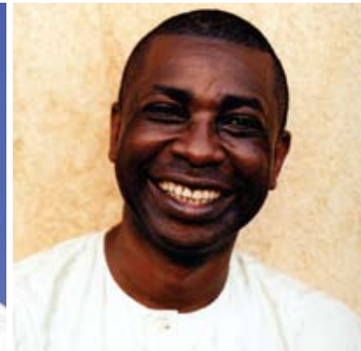
Youssou N' Dour